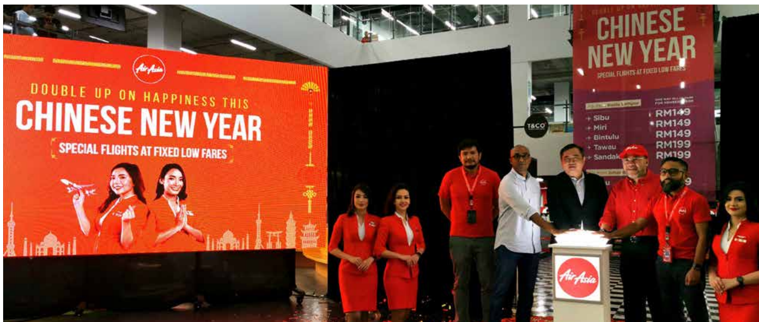
图：希盟也在各族佳节推出廉价机票。