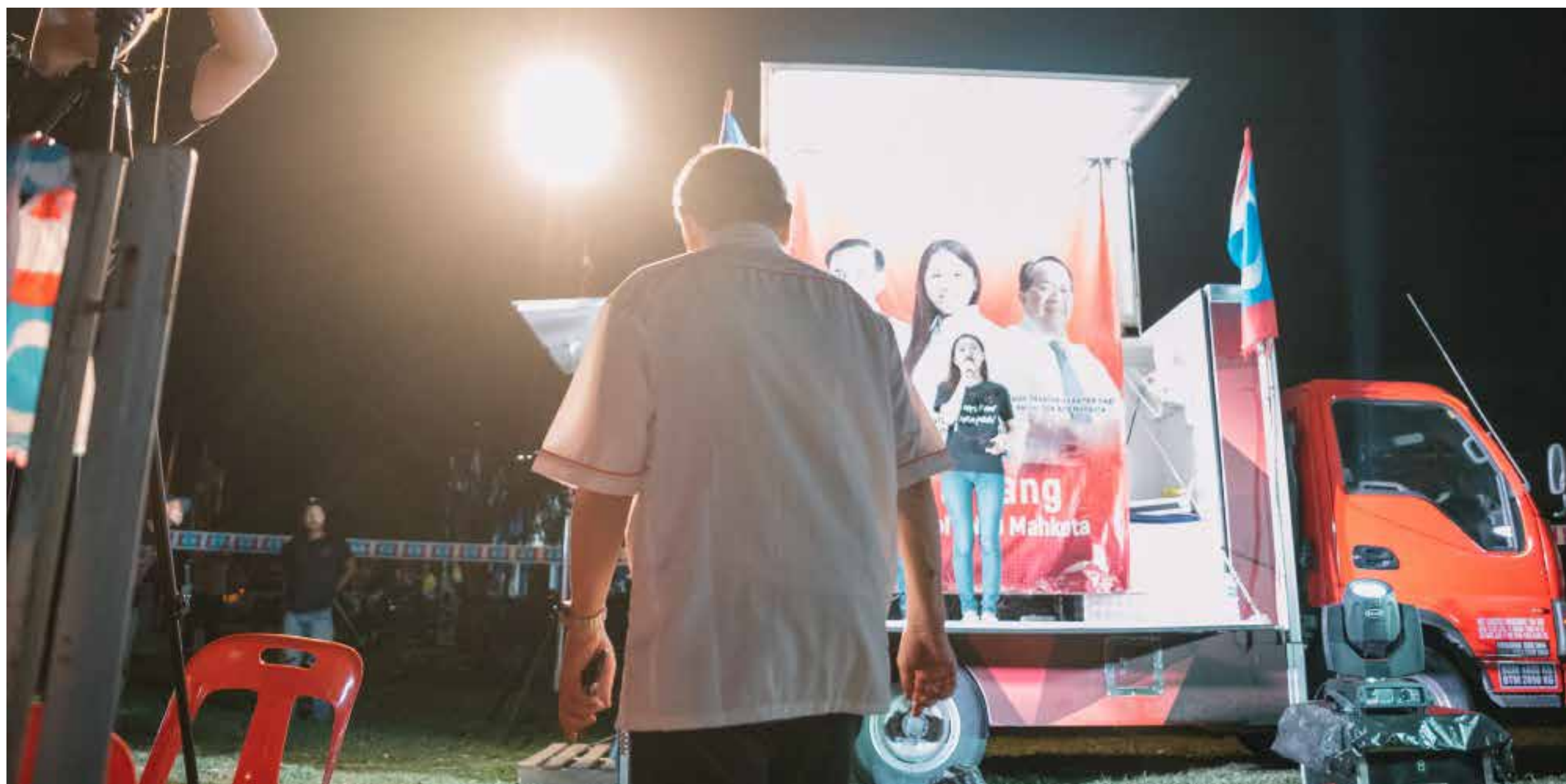
图：林吉祥准备上台演讲的背影。

从现场勘查，召集跨部门的官员协商，到申请拨款、检视招标程序和监督承包商，最后验收工程项目，每一个环节都是学习机会，让过往无从得知的资讯与知识都摊在阳光下，化成无价的执政经验。