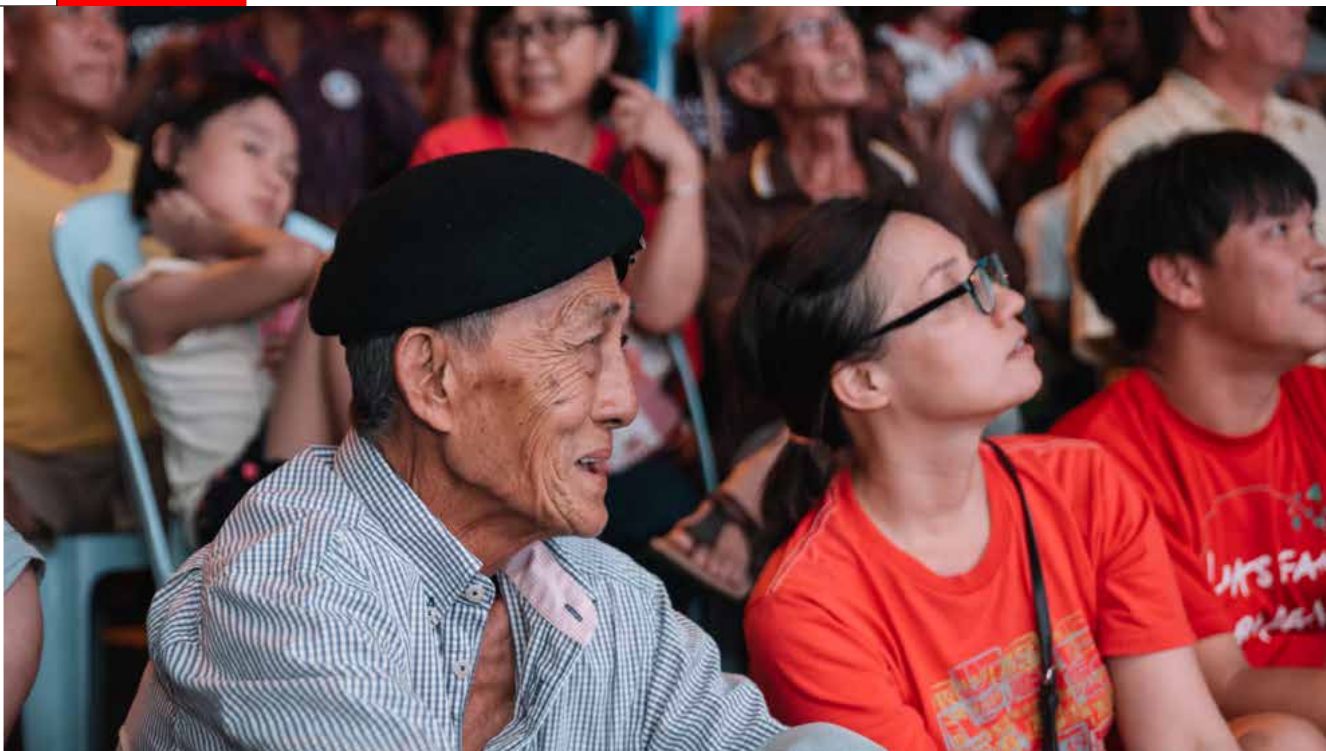
图：民众专心听着大选讲座。

过去，面对不同价值与观念时，我们习惯批判与冲撞，但我们知道作为政府，没有任何一件事情能够自己独立完成，许多事物必须与不同的部门及官员合作，遇见不同主张者，要懂得沟通说服，重要的是把事请谈成，做好。